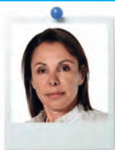
Béatriz de CANDOLLE